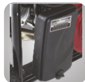
Filtru de aer patentat