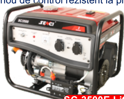
SC-3500E Lite (baterie inclusa)

Alternator Senci de calitate superioara Alerta nivel ulei scazut cu oprire automata a motorului Senzor de suprasarcina cu auto-oprire Filtru de aer nou, mai mic cu un design deosebit ce reduce consumul de ulei si creste puterea generatorului Silentios si prietenos cu mediul Regulator de tensiune AVR Portabil, compact, cadru rezistent Pentru uz casnic dar si comercial Panou de control rezistent la ploaie si praf